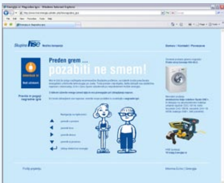
Poučna nagradna igra »Preden grem ... pozabiti ne smem!«